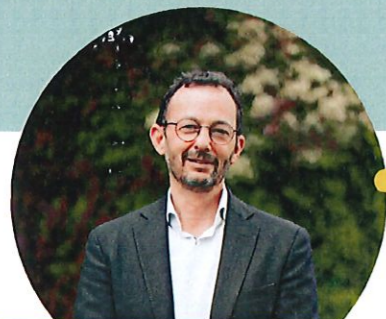
le mot du Président du PNR Chartreuse